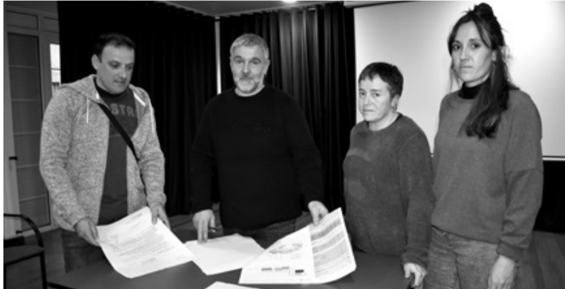
Udal Gobernu Taldeko kideak, DBHko ikastetxearen eta eremuaren txosten, proiektu eta planoekin.

Uztailetik abendura, lantzen 2019ko uztailetik dator gaia. Orduan helarazi zion idatzia Hezkuntzak Udalarari, adieraziz partzela horrek irisgarritasun eza eta malda haundiak zituela, eta eskatu zion beste eremu aproposago bat bilatzeko. Bilera eskatu zion Udalak, «gaia elkarrekin aztertu eta argitzeko»; eta bi dokumentu aurkeztu zizkion: «udal arkitektoaren txostena, adierazten duena partzela iris-