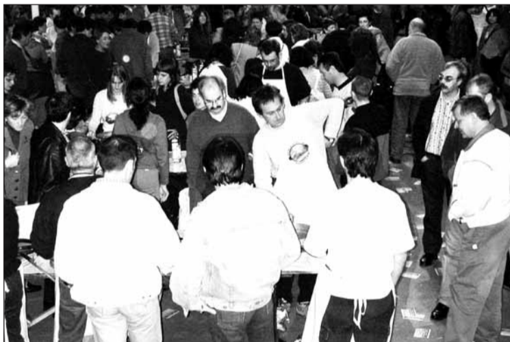
Parte hartzaile eta ikusle asko izan zen bakailu txapelketan.