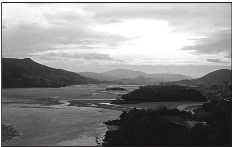
Urdaibaiko erreserba naturala, goitik begiratuta.

BIZKAIKO Golkoko urmahel batean kokaturik, URDAIBAiko natur-erreserba Euskal Autonomia Erkidegokoa den Bizkaiko lurraldeko Busturialdea eskualdean dago. UNESCO-k "biosfera erreserba" izendatu zuen 1984. urtean.