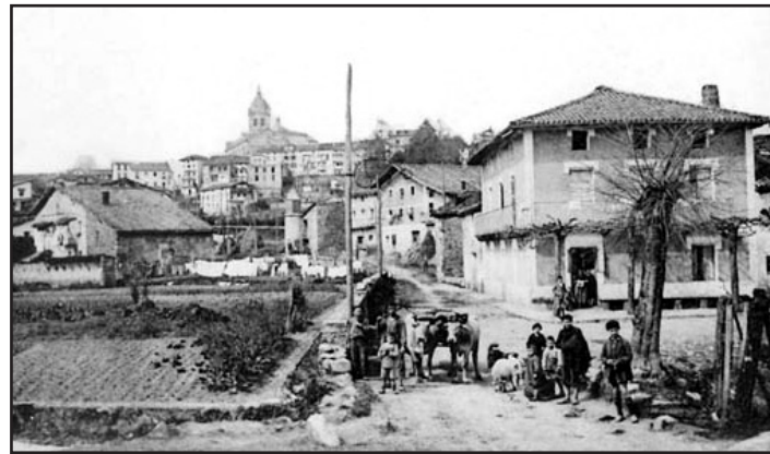
Portu auzoa, XVIII urtean.