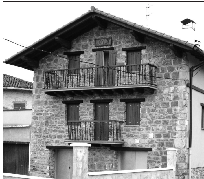
Portu auzoan beti izan da lonja.