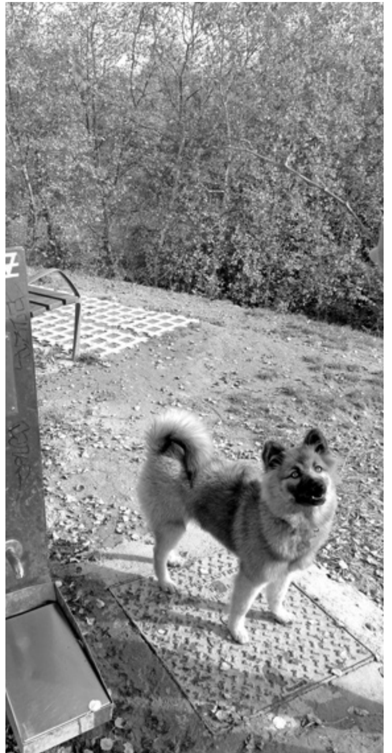
Lilo libre parkean.

Nik uste dut zakurrek lotuta joan behar dutela kalean, baina ez muturrekoarekin. Jabeek hezi egin behar dituzte, eta kitto.