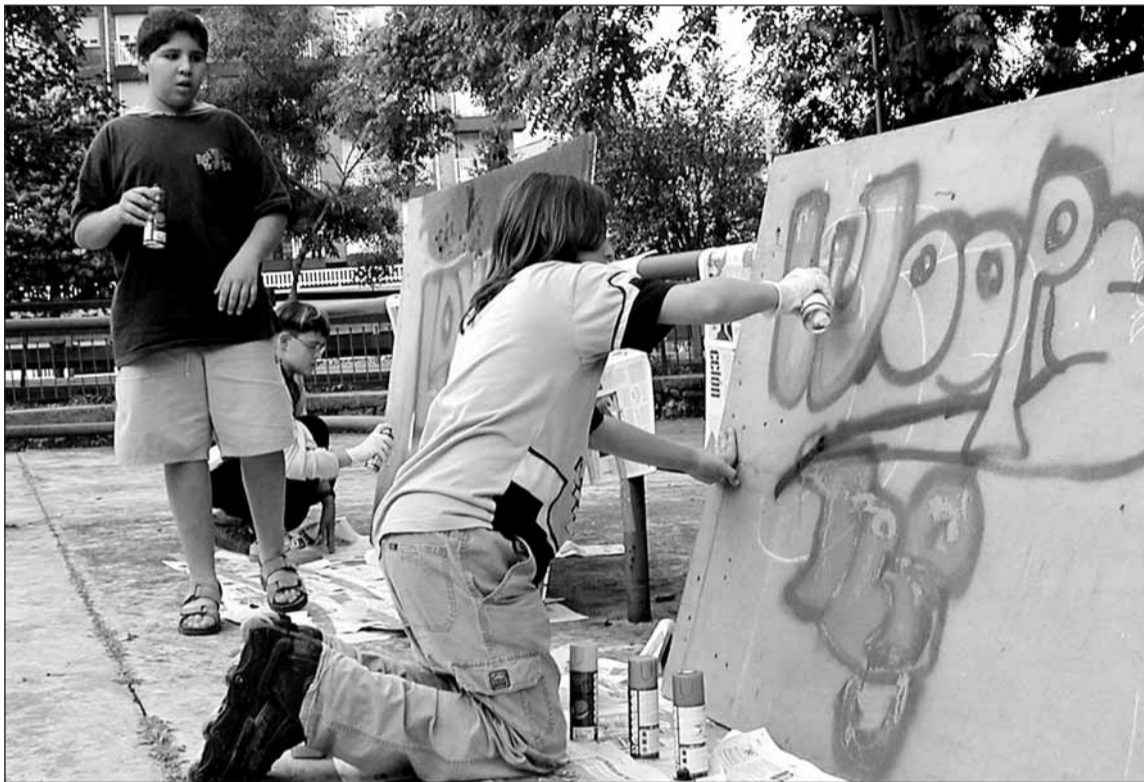
Atzo grafiak egiten aritu ziren gazteak. 30 mutiko pintatzen eta 20 neska goitik begira.

Kale hezitzaileek, atzotik urriaren 20a bitartean zazpi ekitaldi antolatu dituzte. Gaur, ‘skate’ eta patinete txapelketa da Floridan, Elizatxo ikastolako futbol zelaian.