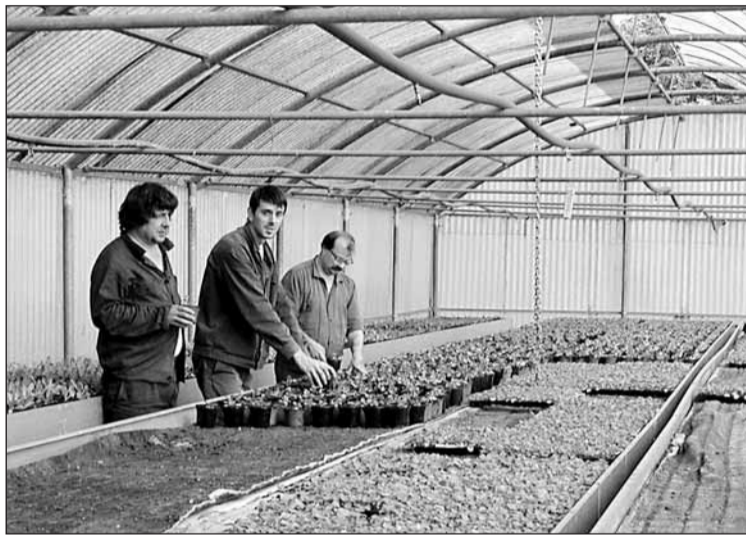
Hernaniko jardinetako lore guztiak negutegi honetan hazten dira.

Gaixoak krisi garaian ospitalean sartu ohi dira, baretzean ostera ere lehengo tokira bueltatzeko. Lehen krisia eragin dioten arrazoi eta gauza guztiekin topo egiten dute, ordea, ospitaletik irtetzean. Zenbaitek halakorik jasan ezin duenez, ospitaletik sartu eta atera ibil-tzeko arriskua dago. Aurre egiteko bizitza normalean aurkituko duten antzeko esperientzia dute negutegietan: goizetik eguerdira arteko lana (barazkiak eta Hernaniko