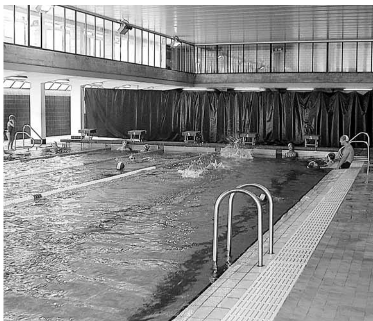
Igerilekuan jende asko apuntatu da aurtan.