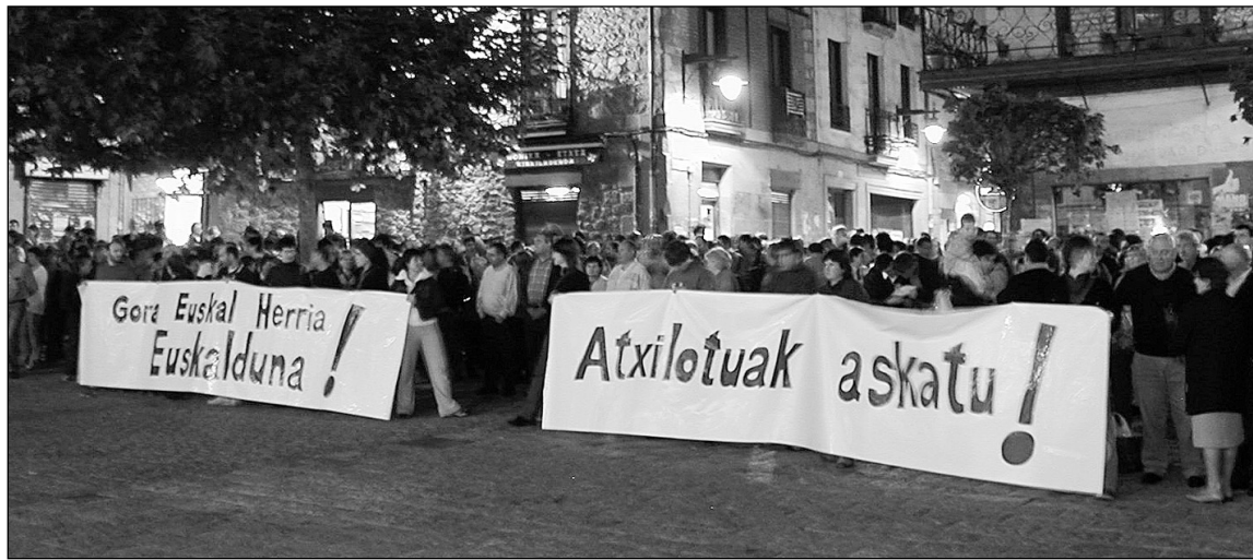
Ostiral gaueko kontzentrazioa plazan. Jende asko bildu zen.