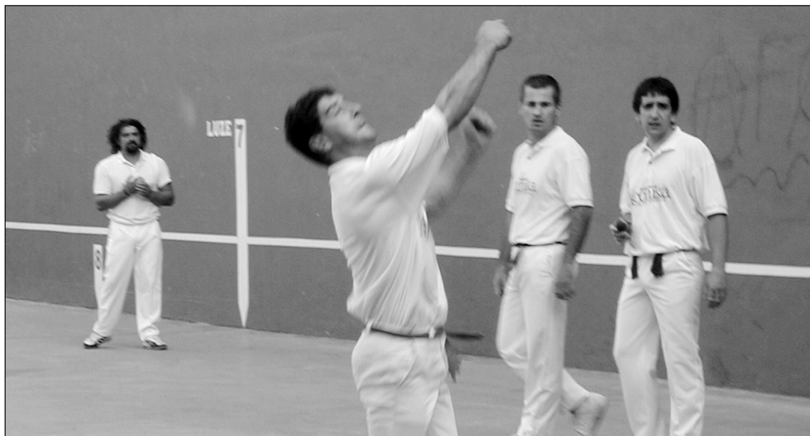
Pelota Txapelketako 3-4garren postua jokatu aurreko beroketan.