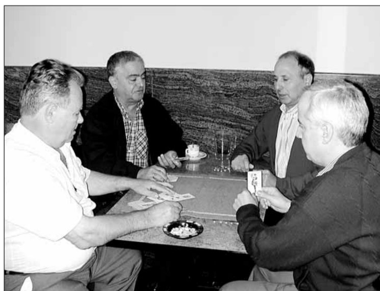
Laukotea Antziola tabernan musean, atzo arratsaldean.