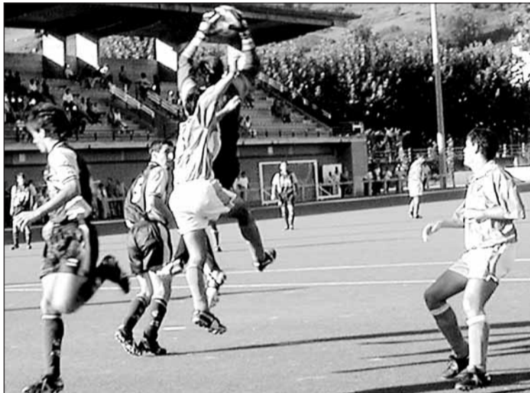
Realaren kontra Zubipen. Datorren partidua ezin du galdu.

0-1 irabazten hasi eta Zamudiok 3 gol sartu zituzten bost minututan. Saikapenean behean jarri litezke.