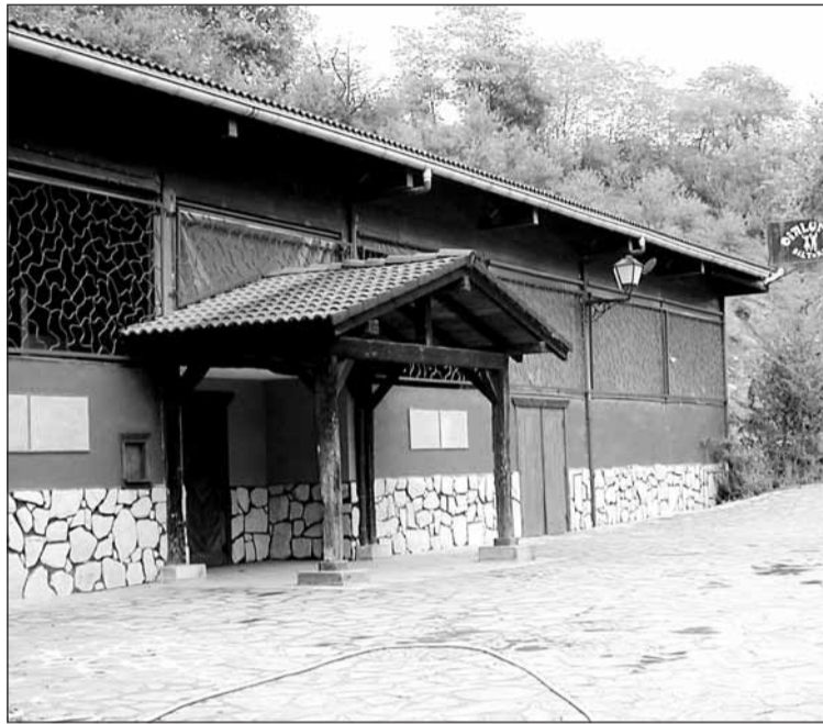
Oialumeko dantzalekuak, aurtengoa noiz hasiko zain.

Igandero dantzaldia izango da gaur hasi eta ekainera bitartean. 20:00etatik, gauerdirate izaten da.