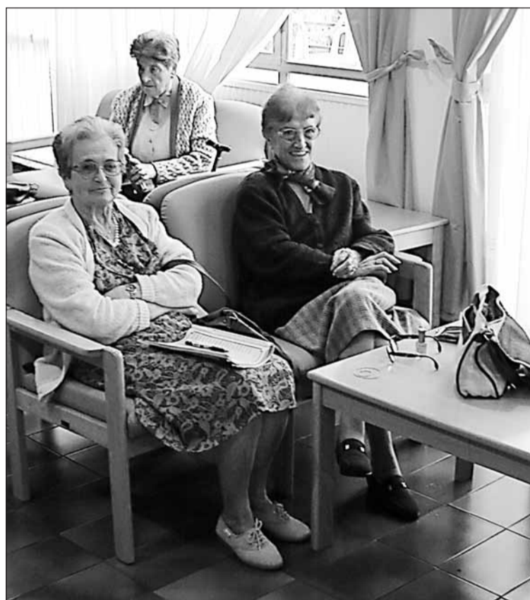
Zaharren egoitzako egongelan irrifartsu.

Batzar irekia izango da, aurreko bileretako sektore ezberdinen iritzia aztertu eta erabakiak hartzeko. 20:00etan hasiko da udaletxeko pleno aretoan.