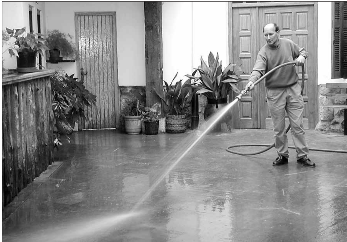
Oialumen errioa atera eta taberna atarian utzitako lokatzak garbitzen, atzo arratsaldean.

Auzotarrak hasarre daude udalak, ez lehengoak eta ez oraingoak, ez dituelako erreko zakarrak garbitu.