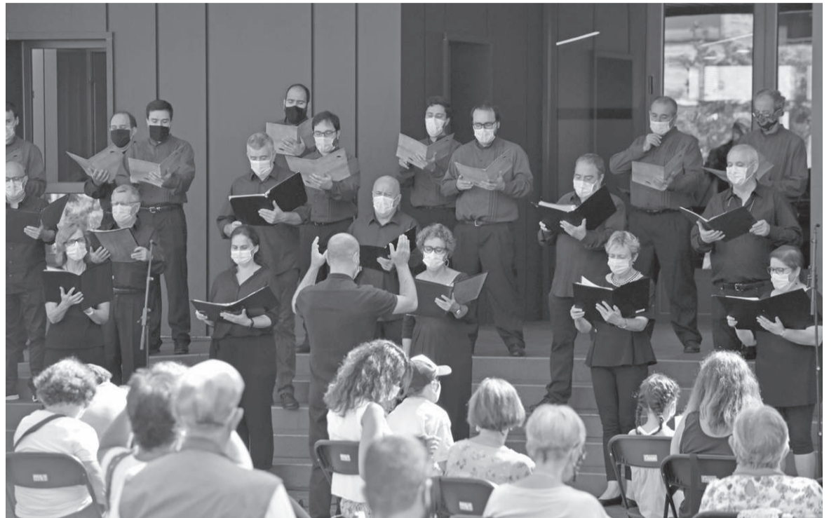
Aiztondo eta Eragiyok abesbatzetako kideak, maskarillarekin kantari, Erribera kulturgunearen inaugurazio ekitaldian.