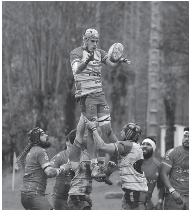
Hernani, urte hasieran, Ordiziaren aurkako partiduan.

Hori horrela, bihar, Madriren jokatuko du talde trikoloreak, Alcobendasen. Eguerdiko 14:00etan hasiko da partidua, eta Les Abelles talde balentziarra izango dute aurkari. Gainera, aurreko denboraldiko Ohorezko B mailako B taldeko