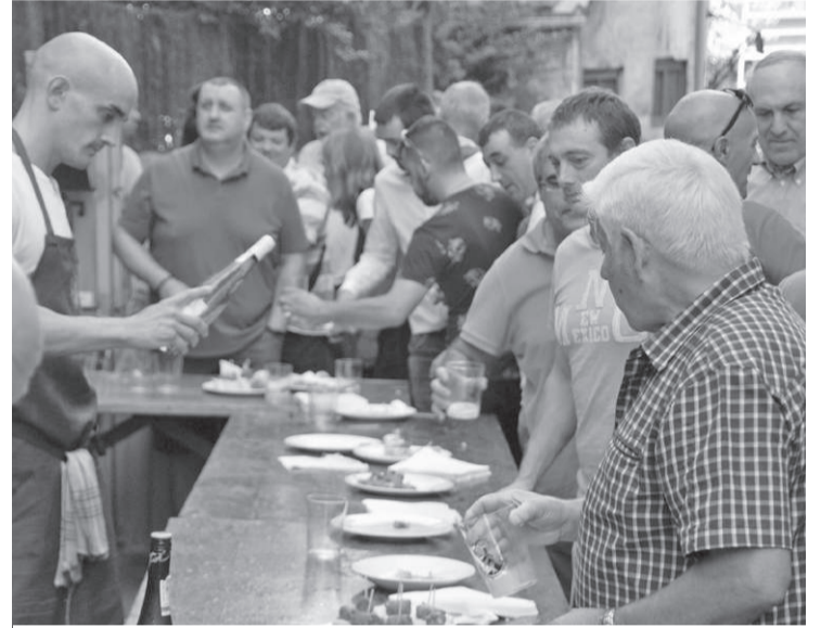
Santa Barbara kanpoan, aurreko urteko Euskal Jaietan.

«Orokorrean esan dezakegu, jendeak egoki jokatu duela, segurtasun neurriak bete direla. Azkenean, elkartera joaten den jende kopurua asko jaitsi da, eta horrek lasaitu egin gaitu Santa Barbara ixteko erabakia hartzerako garaian».