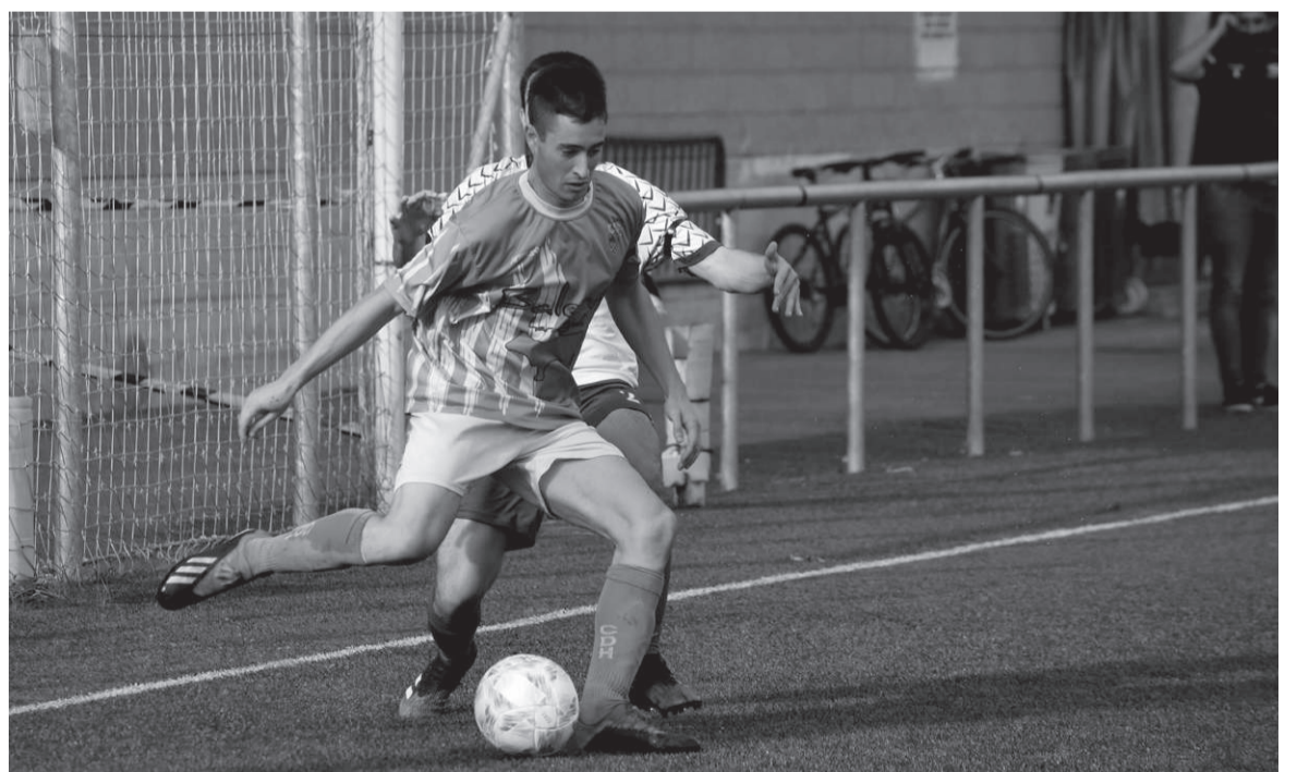
C.D.H.-ko jokalaria baloia hanketan duela, joan den asteko Añorgako partiduan.

Federazioak klubekin egindako bilera guztietan jakinarazi duenez, pandemiaren bilakaerak markatuko du lehiaketaren garapena. Hori horrela, datozen egunetan bilakaera horren arabera erabakiak hartuko dira, «betiere gure kirolarien osasuna lehenetsiz». Ondorioz, Astigarragan eta Hernanin ez da