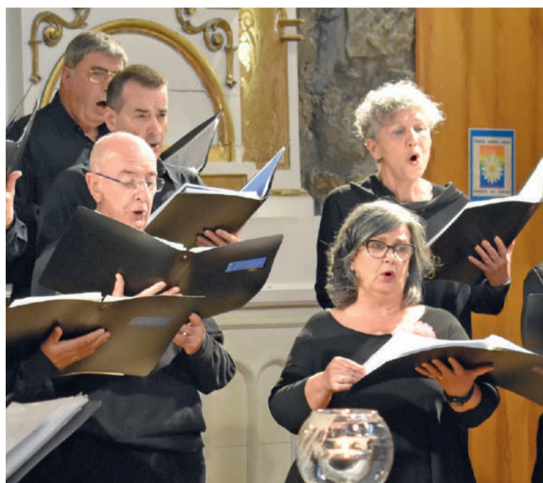
Kantuz abesbatza, joan den urteko Kantuz Egunean. Aurten online egin dute.

Distantzia eta maskarillekin batera, gainerako neurriak ere hartzen dituzte: «Milagrosara sartzeko, maskarilla berri bat ematen diogu bakoitzari, eta gel hidroalkoholikoarekin garbitzen ditugu eskuak. Lurrean gurutze batzuk daude markatuta, jakiteko non jarri behar duen bakoitzak, tarrea uzteko. Milagrosako goiko leihoak eta atea zabalik edukitzen ditugu. Eta entsaioen aurretik eta ondoren, aulkiak desinfektatzen ditugu. Gehiago ezin dugu egin».