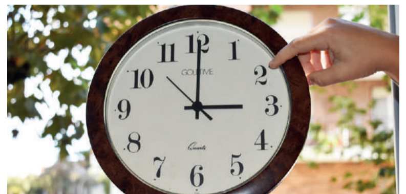
Goizeko 03:00etan, 02:00ak izango dira.

Abantailak zein desabantailak ditu, ordu aldaketak, eta hainbat azterketa egin dituzte, horretan oinarrituz. Askok adierazten dute «gure organismoa errazagoa dela urriko ordu aldaketara egokitzea; udaberrian, berriz, ez da hain erraza, batez ere berandu oheratzeko eta goiz jaikitzeke ohitura dutenentzat. Jet lag -ekin gertatzen denaren antzekoa da efektua: honek eragin handiagoa du ekialderantz goazenean eta, beraz, denbora galtzen dugu mendebalderantz