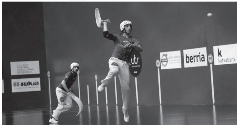
Kutxabank Torneoko finalurrekoan erremontistak, Galarretako frontoian.

Bost asteko atsedendialdiaren ostean Galarretak atek ireki behar zituen berriro ere, aste-buru honetan. Gaur ziren jokat-