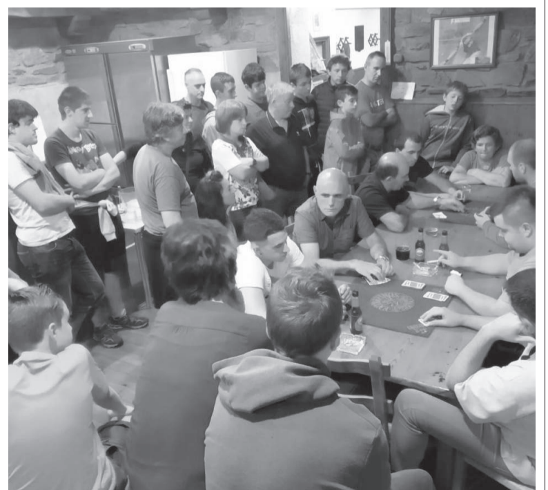
San Roke elkarteetako mus txapelketan herritarrek, aurreko urtean.

San Roken, aipatu moduan, zorrotz bete dira ezarritako neurriak, hala nola, maskarilen erabilera, mahaietako distantziak, gel desinfektanteak, pertsonen arteko distantziak ere, higiena, eta beste hainbat gehiago.