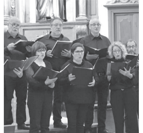
Santa Zezilia egunez kantatu nahi du Aiztondok.

Bi entsaio izaten dituzte, astean: horietako bat, soka bakoitzak (sopranoak, tenorrak, altuak eta bajuak) bere aldetik egiten du; eta bestea, ostiraletan, denak elkarrekin: «bigarren hori, berriro Herri Eskolara mugitzeko asmoa daukagu, espazio gehiago edukitzeko. Izan ere, abesbatzako kide guztiak ari gara entsaia-