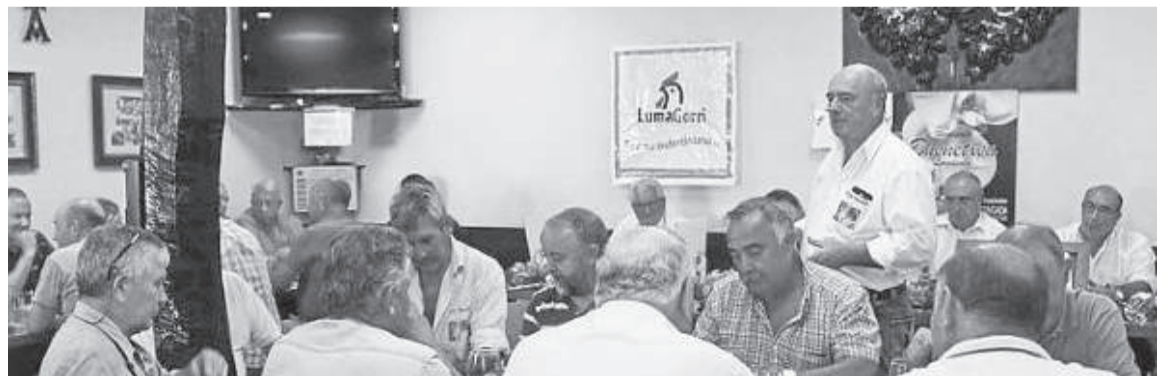
Aurreko urteko irailean, Astigarragako Gure-Izarra elkarteak egin zen sagardo dastaketan.

Gure Izarra elkarteak zuzendaritzak, Whatsapp bidez bildu dira, «talde bat daukagu eta hortik hitz egin genuen dena». Bazkideek, itxiera honen berri jakiteko, Gure Izarra elkarteak kartel bat jarri zen, eta horrez gain, «emailak ere bidali ditugu, egoera zein den informatzen eta zer erabaki