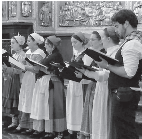
Kantuban, Gabonetako kontzertu batean.

Donostiako hori izan da, pandemiaren hasieratik eskaini duten kontzertu