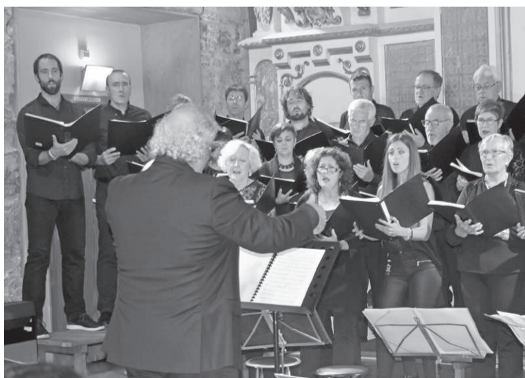
Oraindik ez da entsaiotara bueltatu, Ozenki abesbatza.