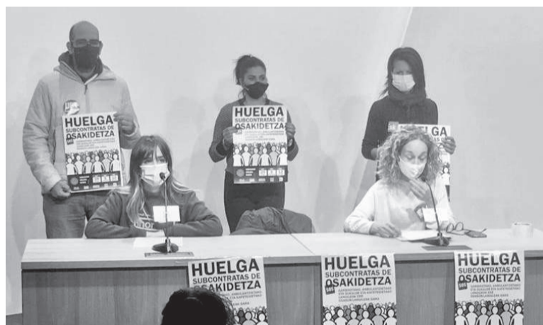
Sindikatu etako ordezkariak, joan den eguneko prentsaurrekoan, Bilbon,

Joan den asteazkenen prentsaurrekoa egin zuten bederatzita sindikatu deitzaileek Bilbon, eta mobilizazio berriak iragarri zituzten. Salatu zuten ez dagoela