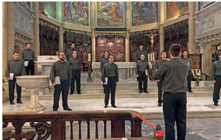
Eragiyok abesbatzako kideak, aurreko astean, Groseko San Inazio elizan.

Entsaioak ez ezik, emanaldiak ere eskaini ditu Eragiyok, pandemia hasi zenetik. Uztai-