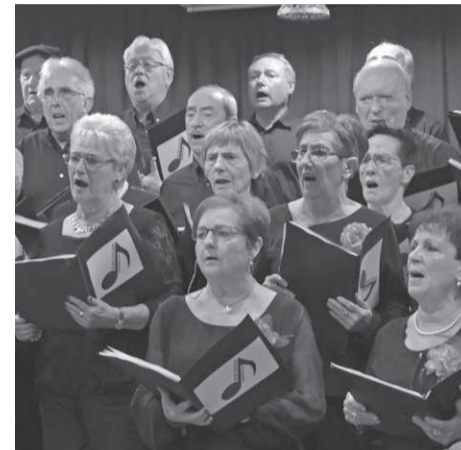
Goiz Eguzki abesbatza, Gabonetako saioan.

Bi inkesta egin dituzte pandemia hasi zenetik, jakiteko abesbatzako kideak prest dauden entsaioetara bueltatzeko: «57tik, aurrenekoan hamabik eman zuten baiezkua, eta duela bi aste, bigarrenetan, hemezortzik», diote. Baimena jasoz gero, horiekin hasi nahi dute: «jendeak behar du etxetik atera eta besteekin elkartzeko, eta hori da garrantzitsua. Gaizki kantatzeak, berdindio».