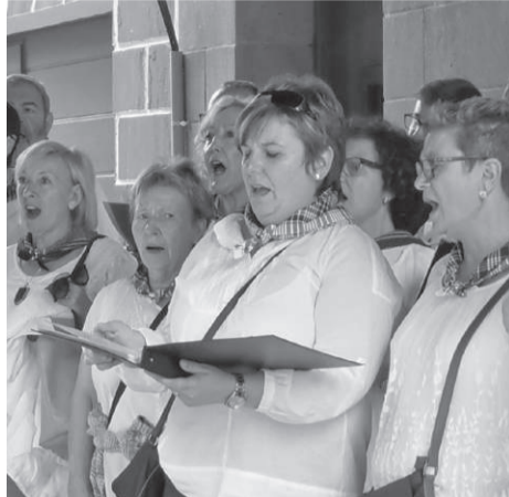
Umore Ona abesbatzako kideak, kantuan.

Azkeneko saioa, dena den, aurreko astean egin zuten, elizan bertan: «hileta elizkizun bat izan zen, eta eskatu ziguten, beste hainbatetan bezala, kantatze-