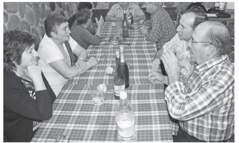
Duela urte batzuk, Ereñotzuko Ur-Mia Elkarteak, hainbat bazkide afaltzen.

ten hasiera batean Ur-Mian, eta herritarrek bete dituztela ziurtatu dute, «ordutegiak bete egin dira, eta jendeak errespetatu ditu elkarteak jarritako neurriak. Gu ez gara egunero egon elkarte ikuskatzen, baina badakigu aipatu moduan, jendeak ondo jokatu duela, zentzuz eta jarritako neurriak errespetatuz».