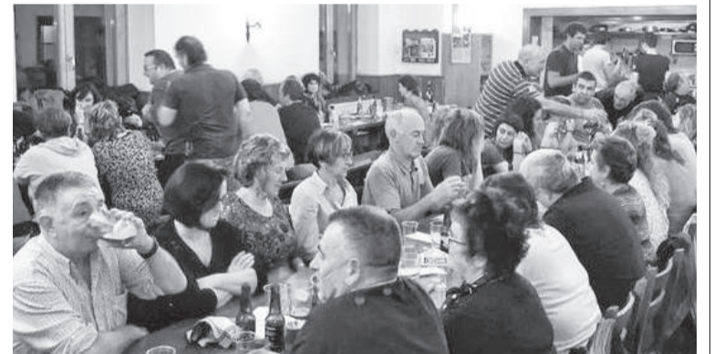
Umore Ona Elkarteak beteta, pandemiari gabeko garaian.

Orain arte ezarritako neurriak zorrotz bete dira, elkarteak gainera sekziotan banatu dute goizuetarrek, herritarren segurtasuna bermatze aldera.