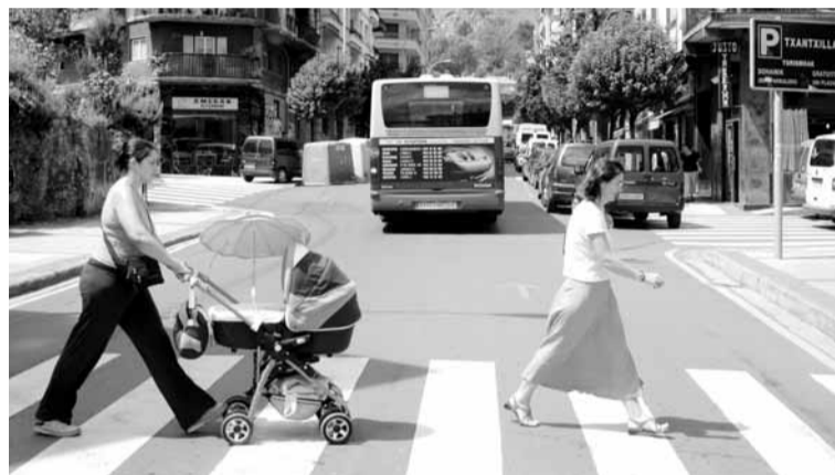
BHK epe luzerako aurreikuspena nahi du trafiko erabakietan.

Epe luzerako aurreikuspena Bildu Hernanik adierazi du Udalak erabakiak hartzen dituela trafiko Plan Orokor bat izan gabe eta herri plataformaren ustez orain arte hartu diren trafiko erabakiak "puntuak" dira eta ez dute "epe luzerako aurreikuspenekin jokatu". BHren hitzetan "ez du ematen Karmelo Labaka, Latxunbe, Zinkoenea eta abarretan dauden arazoak konpontzeko balioko dutenik; alderantziz, arazoak gehitzen dira eta etorkizuneko konponbide zailagoa izango dute".