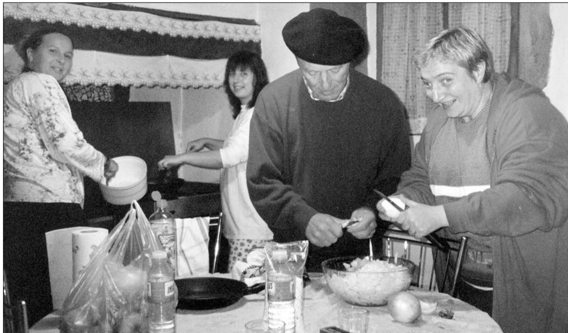
Udal Euskaltegiako ikasleak barnetegian.