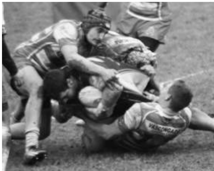
Lagunarteko partidua izan arren, serio jokatu zuten bi taldeek.