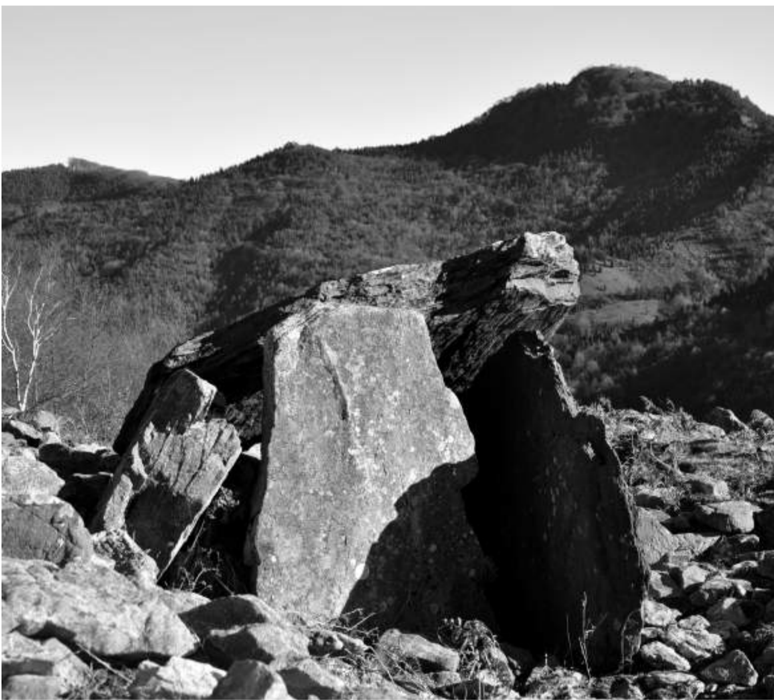
Saratxeta lepoko trikuharria; Hernanin asko daude, Akolan...

Eta ikasitako guztiaren ondorioa probatzea izango da menuaren ginda: sagardoa.