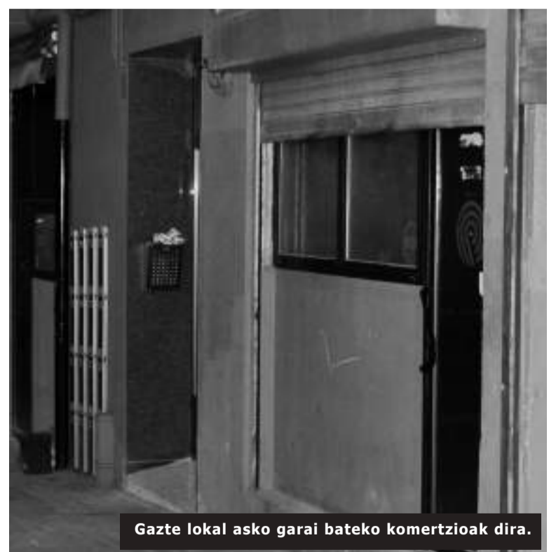
Gazte lokal asko garai bateko komertzioak dira.

Eta azkeneko fasean, hiru bilera egingo dituzte, guztiak elkarrekin. Otsailaren 13an,