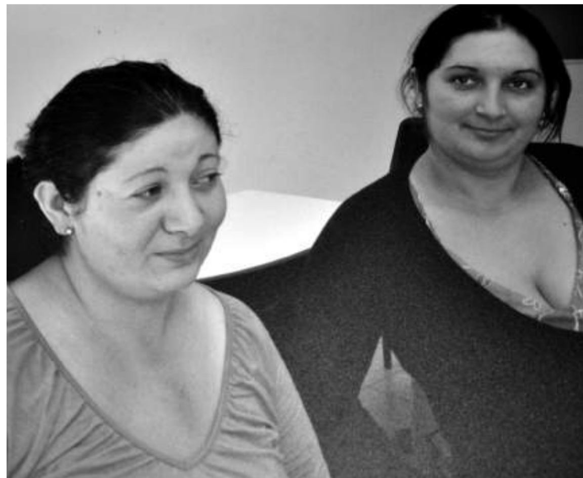
Argazkiek eta esanek osatzen dituzte erakusketan jarritako panelak.

dituzte. Errumanian bertan, 1864ra arte, esklabotzan eta zortasunean bizi behar izan zuten. Nazi erregimen garaian pertsegitutako herrialdea izan ziren. Bigarren Mundu Gerra eta gero, dispertsio politikak ezarri zituen Errumaniako Gobernu komunistak, eta rrom herrialdea onartzeko pausuak eman zituzten; lan munduan barneratu zituzten, hori bai, beti