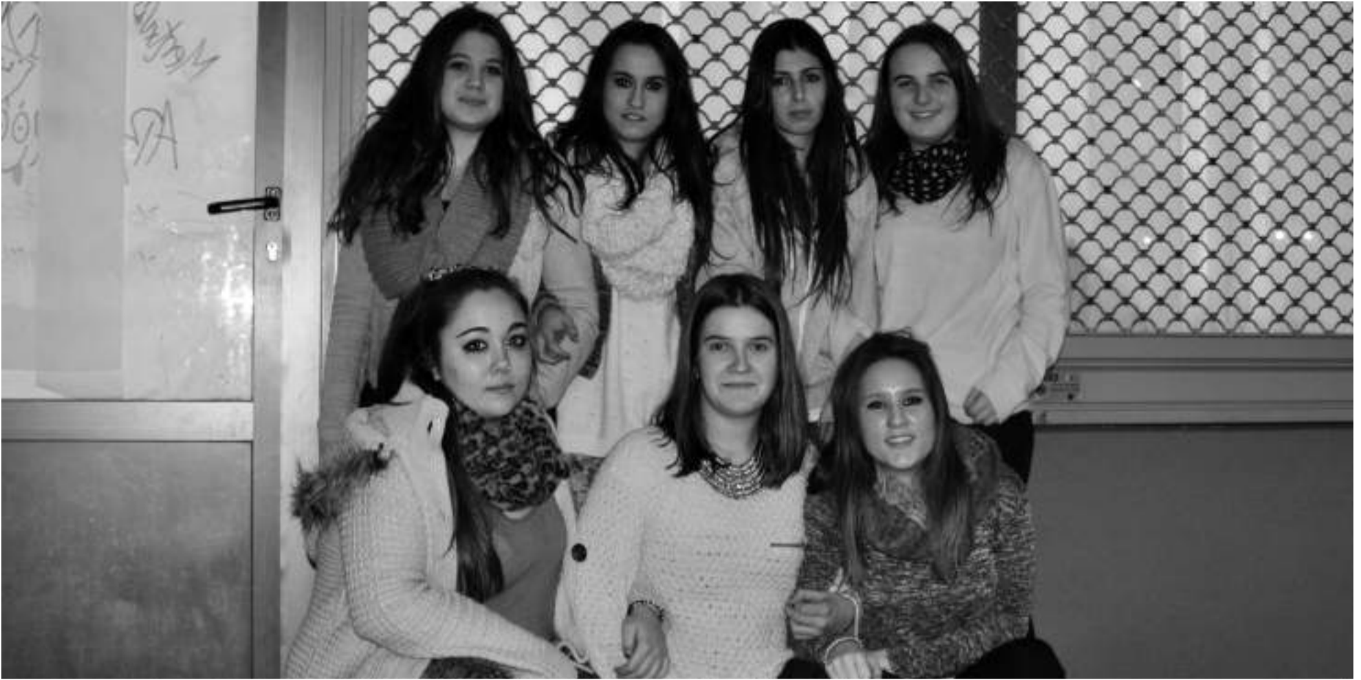
Koadrilan elkartzeko guneak dira gazte lokalak; 20tik gora daude Hernanin.