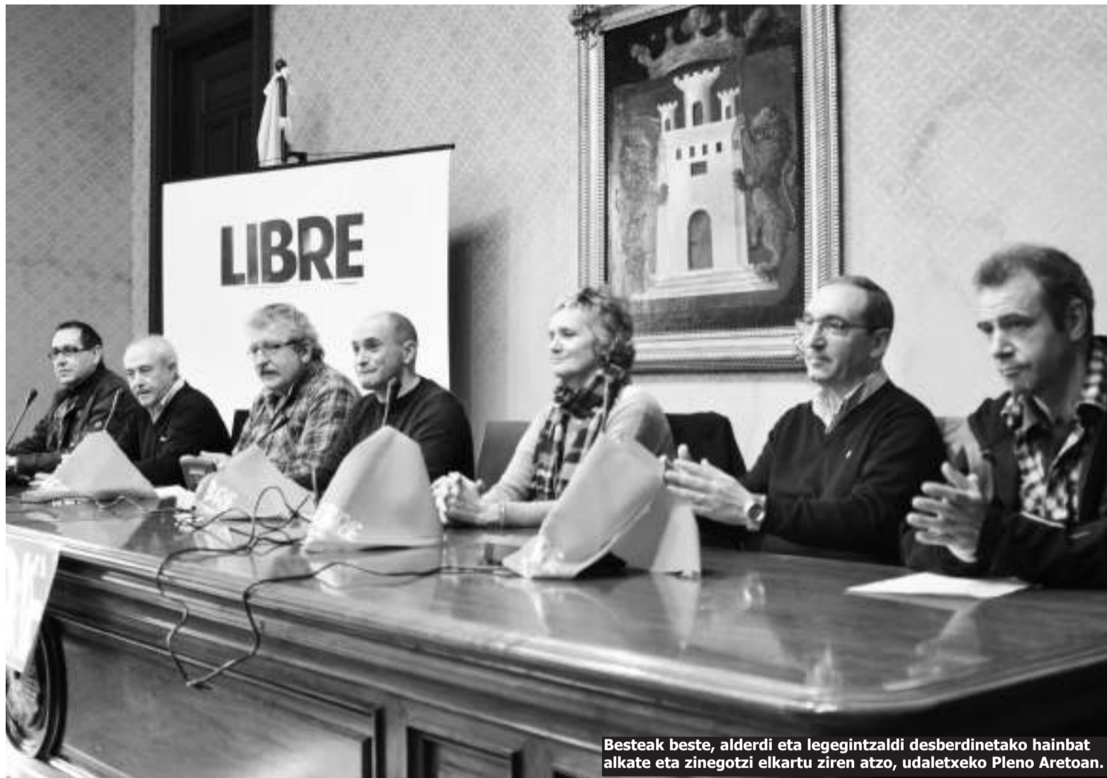
Besteak beste, alderdi eta legegintzaldi desberdinetako hainbat alkate eta zinegotzi elkartu ziren atzo, udaletxeko Pleno Aretoan.