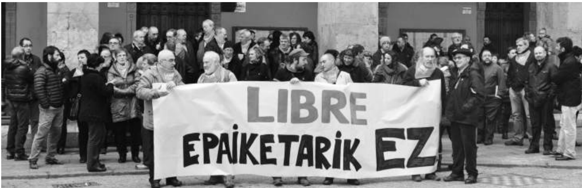
Idatzia adostu eta onartu ostean, kontzentrazioa egin zuten Plazan. Herritar ugari egin zuen bat deialdiarekin.