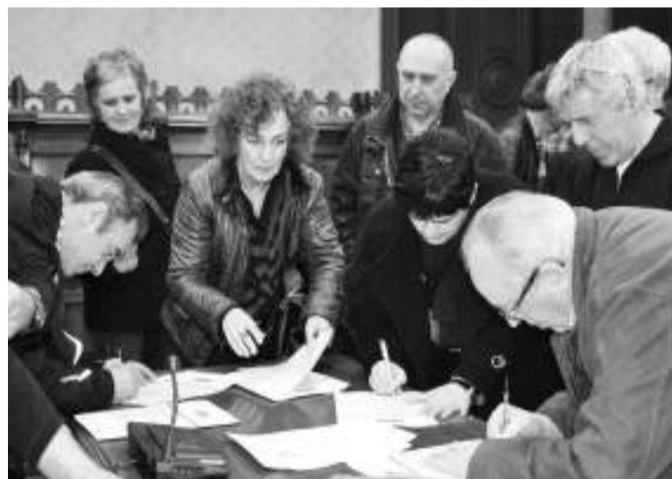
Libre Manifestua sinatzen.