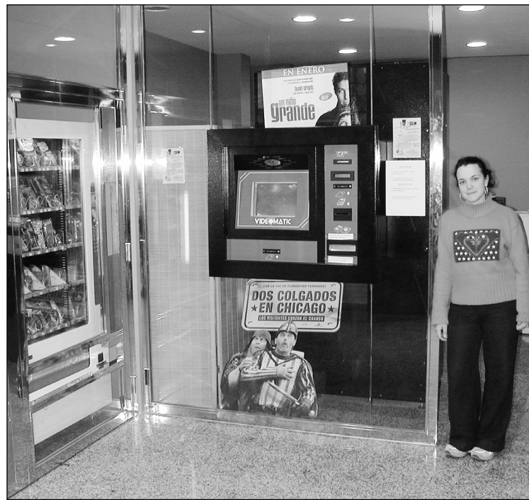
Luber bideo denda irekita egoten da txartelak hartu ahal izateko.