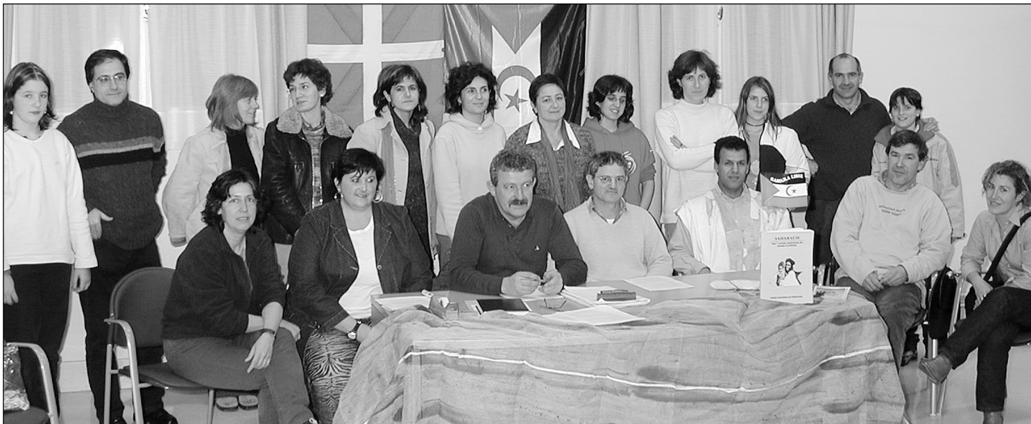
Udaletxeko Kooperazio Arloaren laguntzaile taldeko kideetako batzuk, Sahararen aldeko ekitaldia aurkezten, Biterin.