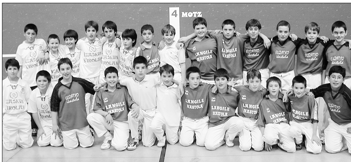
Langile, Urumea, Elizatxo eta Txirritako pelotariak lehengo larunbatean.