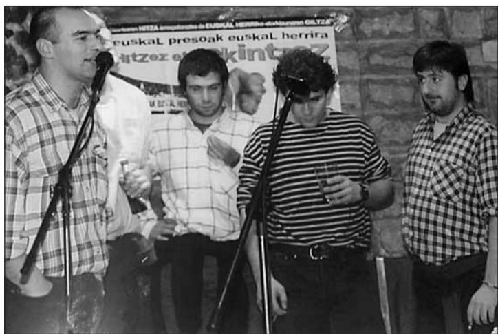
Xapo, Xanta, Barrenetxea eta Oxan iazko txapelketan.