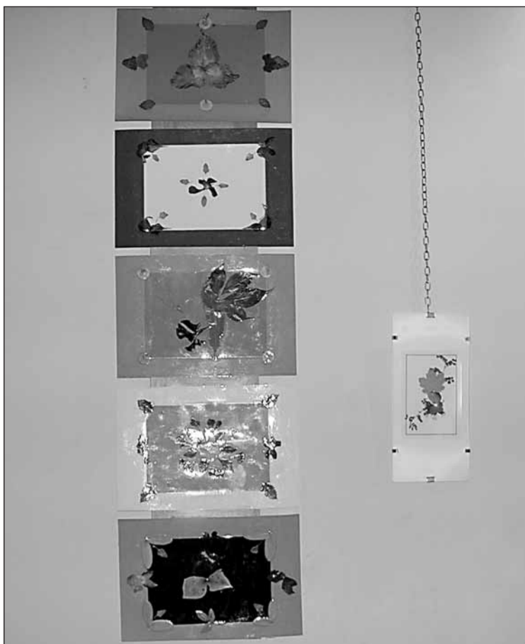
Erakusketako lan multzo bat.