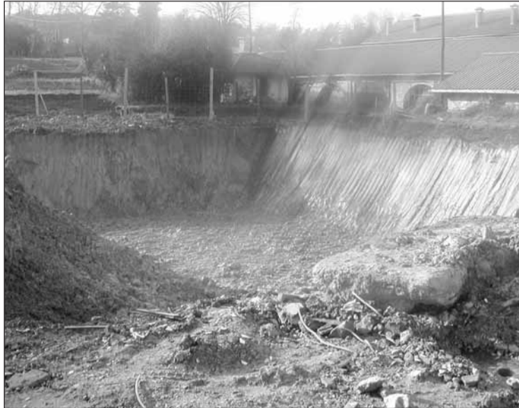
Imazeneko etxea zena; oso behera zulatu behar izan dute.

Goizeko 09:00etatik 11:15 arte itxita egon zen Antziolako bidea, atzo. Zorua metro eta erdiren bat zulatu zuten behe- ra, baina, alperrik; han ez zen gerra zibileko artilleriarik azaldu. □