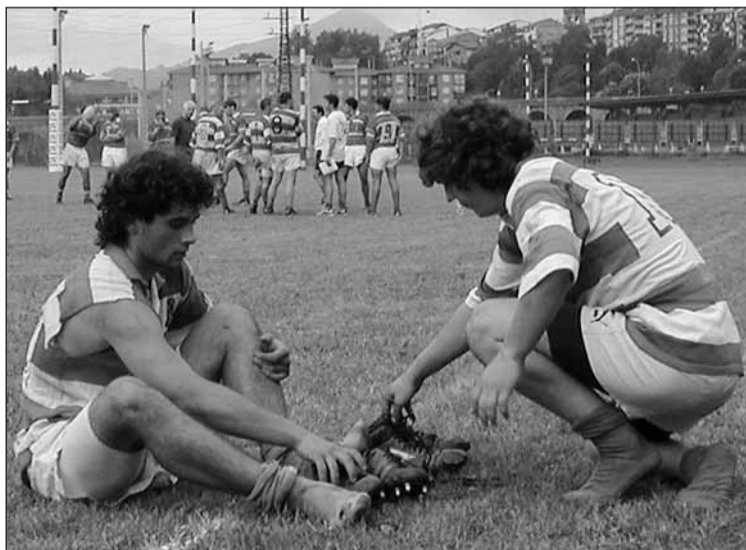
Hernaniko defentsak ez al ditu izango galtzerdiak adina zulo!

Denak ematera irten behar dute gaur hernaniarrek; Gernikari irabazi ezean maila galtzeko arrisku handia baitute. Irabaziz gero, berriz, badirudi arnastu bat hartzeko moduan izango direla. □