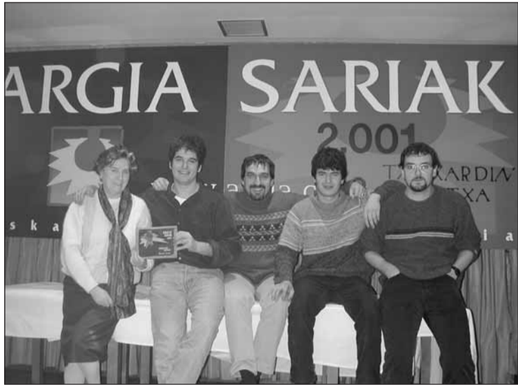
Kronikak saria jasota pozik, atzoko ekitaldian.

■ Prentsa idatziaren saria jaso du 'Hernani Komunikazioak' lan taldeak ■ Lan taldeak Kronika lagundu duten guztiei eskaini die sari hau.