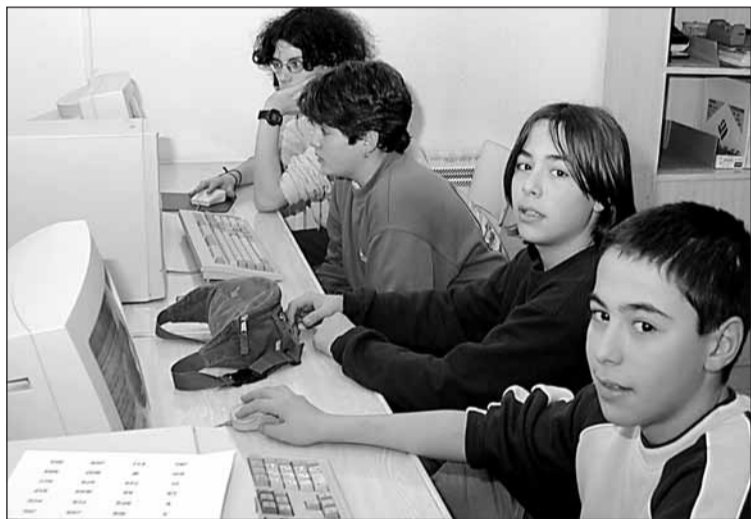
Skateliariak interneten, atzo, Informatika Aretoan.

■ Skateren bueltan bildutako gazte koadrilla web orri bat egin nahian dabil.