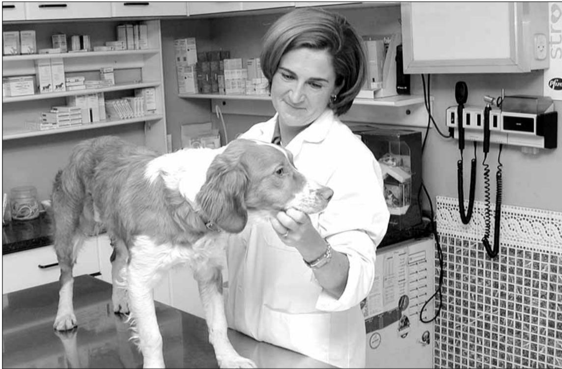
Mamen bere azken bezeroari errebisioa pasatzen, Orkolagako kontsultan.

■ Jende askok du txakurra etxean; eta katur ere gero eta gehiagok ■ Ondo bakunatu eta zaindu behar omen dira animalia hauek.