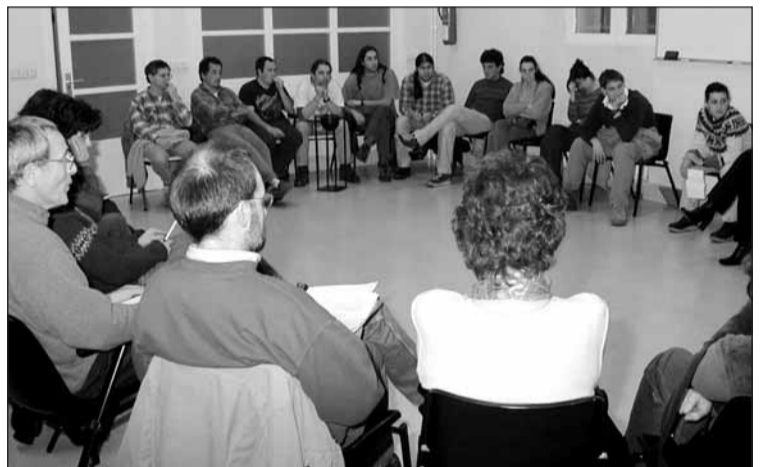
Batasuna prozesuko batzarra ostegunean, Biterin.

■ Giro ona eta ikuspegi ezberdinak nabarmendu ditu koordinatzaile batek ■ Orain, enmendakin fasea.