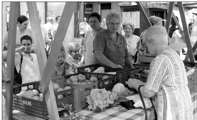
Behemendiko azoka larunbat eguerdian Plaza Berrian.