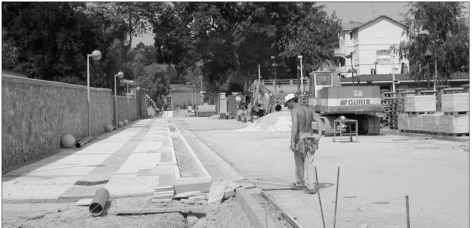
Antziola-Latsunbe enlazeako obrak oso aurreratuta daude eta hilabete honen azkeneko bukatuta egon litezke.