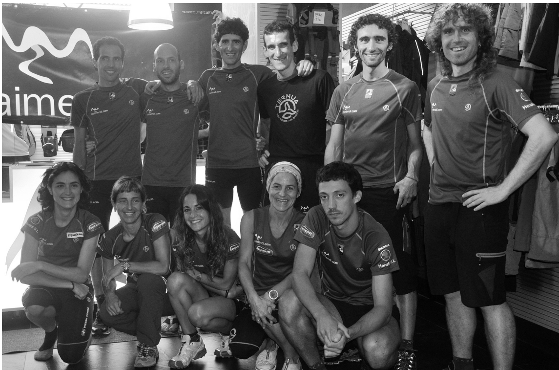
Mendi lasterketetan dabilzan euskaldun onentsuenak, Ibai Mendin izan ziren larunbatean.

EGURALDIA GAUR Goiza eguzkitsua eta lasaia izango dugu gaur, eta arratsaldean euri eta trumoi arriskua. Iparrak joko du egun guztian, baina ahul. Min.17° / Max.26° BIHAR Eguraldi oso tankerakoa bihar ere. Eguzkia nagusi, laino gutxi eta oso goian, eta arratsalde partean euri arriskua. Trumoiak ere jo dezake. Min.17° / Max.27° (euskaletan)