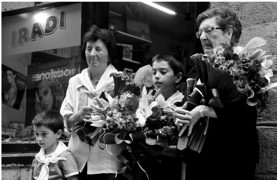
Omendua eta alkate berria, laguntzaileak ondoan dituztela.