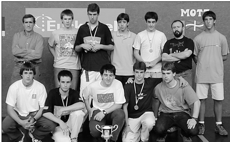
Euskal Herriko Txapelketako iazko argazkia. Hernanik bigarren egin zuen, baina, orduan ere kejavu zen Baztanen beste herritako pelotariak jokatzeko zutela-eta.

Atzoko prentsaurrekoan Udal Gobernu Taldeak hartutako zenbait neurriren kontra ere hitz egin zuten Bildu Hernaniko ordezkariak: “1) Udaletzeko ate nagusia beti itxita egotea eta bai udal zerbitzuetara eta bai plenoetara dijoazen herritarrak atzeko atetik sartu beharra. 2) Udalaren aurreko legealdian buru belarri lanean aritu ziren pertsonak arrotzak bezala hartzea Udal Gobernu honek, eta sartzeko identifikatu beharra sobera ezagutzen gaituzten Udal langileen aurrean. 3) Aldiz herriarentzat ezezagun diren batzuk, bizkartzainak kasu, bere etxean bezala ibiltzen dira Udaletxean. 4) Asteazkenean, Pleno berri bat izan zen, eta urjentziakoa izango zen noski, herritarrak eta bide batez Bildu Hernaniko ordezkariak jakiteko posibilitaterik izan gabe, izan ere ordu pare bat lehenago dei-tua izan zen, beharrezko plazo guztiak aintzakotzat hartu gabe” salatu zuten. □