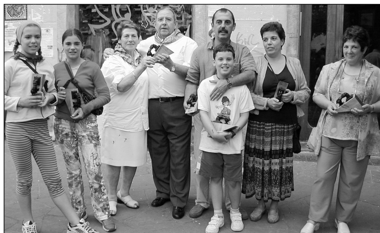
Museko eta eskobako sarituak eta sari emaleak.