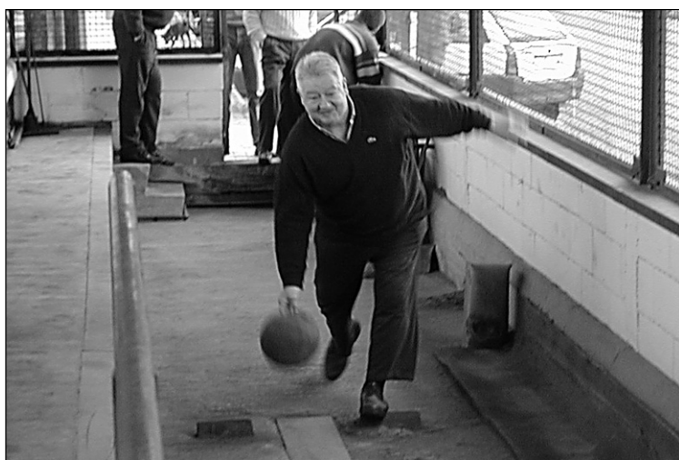
Zelarain bola botatzen.

Hurrengo tiraldia abuztuaren 3an egingo da Aian eta hernaniarrak bertan izango dira. □