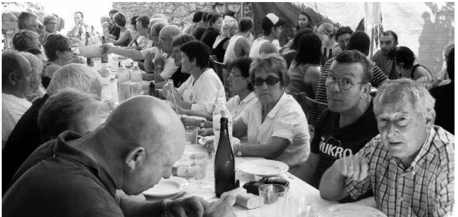
Santa Barbaran giro ederra izaten dute bazkal garaian ere.

Era guztietako planak egiten ditu jendeak San Inazio egunean, Santa Barbaran. Lekuak duen gauza ederra da, denentzako aukera jartzen duena. Oraindik nahikoa eguzki hartu ez duenak ez du zirrikiturik faltako nahi adina hartzeko. Beste batzuen iritziz ordea, itzala da eguzkiaren gauzarik ederrena, eta hori ere topatuko