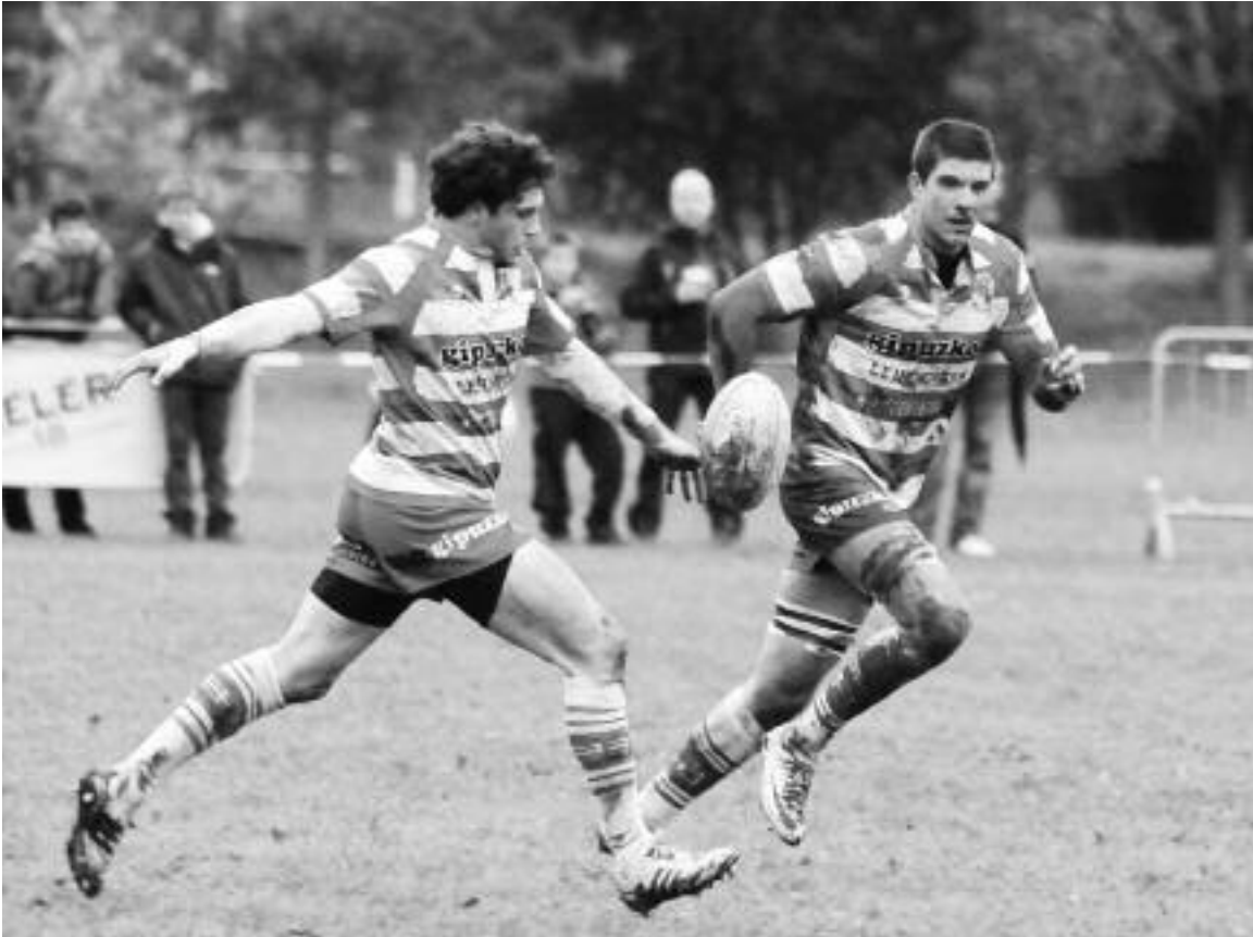
Hernanik 31-47 galdu zuen joan den denboraldian, Landaren, Valladolideko 'Quesos' taldearen aurka