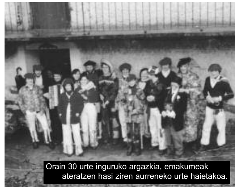
Orain 30 urte inguruko argazkia, emakumeak ateratzen hasi ziren aurreneko urte haietakoak.

Tradizioz, ezkondu bitartean ateratzen ziren gizon eta emakumeak, Zomorro jantziz. Orain hori ere, aldatu dela diote: «urte guzti hauek eta gero, gu berriz animatu gara ateratzera; orain seme-alabak, bilobak... elkarrekin ateratzen