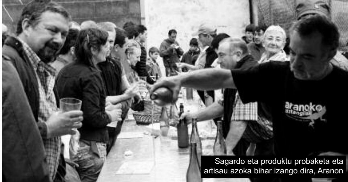
Sagardo eta produktu probaketa eta artisau azoka bihar izango dira, Aranon

Iluntzea Tapia eta Leturiaren trikiti doinuek