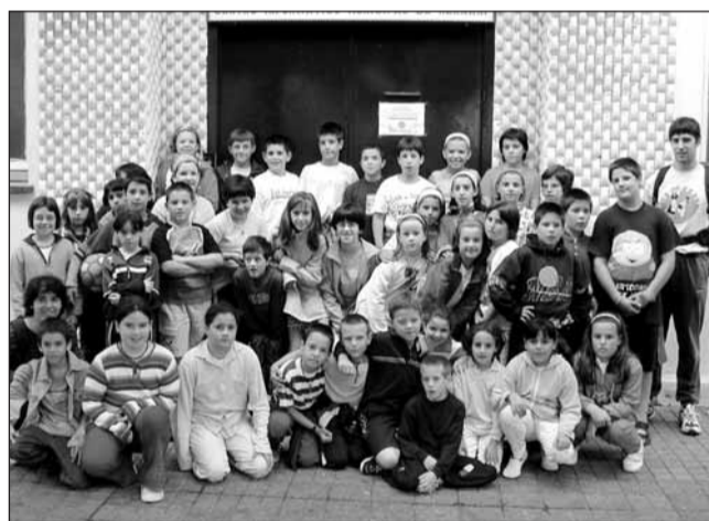
Inmaculada eta Langileko taldeak.

berezia dute Udalekuetan. Txikienean, 3-4 urtekoek, Koadrilla eguna dute. Gay Murren, San Joanetako koadrilla egunaren antzera, festa izango dute txaranga eta guzti. 5 urtekoen