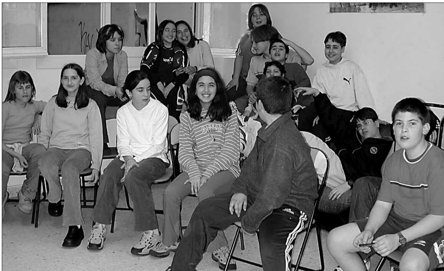
Hernaniko umeak Gazte Txokoan.

■ Gazte Txokoa eraman duen taldeak balorazio 'oso positiboa' egin du ■ Azken bi-hiru hilabetean ume gutxiago joan da eta horrek heziketa lana erraztu egin du ■ Ekainean bukatu da eta udazkenean segiko du.