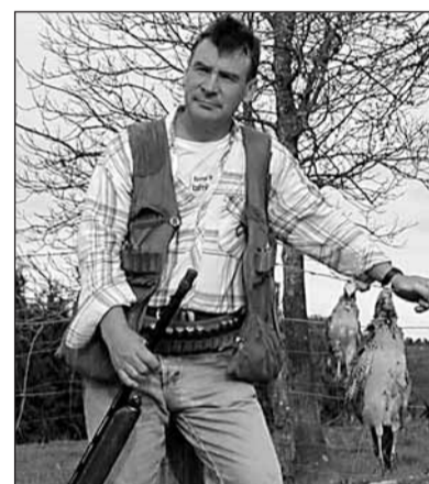
Hernaniko ehiztari bat

■ Jasotzeko, 10:30etatik 12:30-etara eta 19:00etatik 20:30etara.