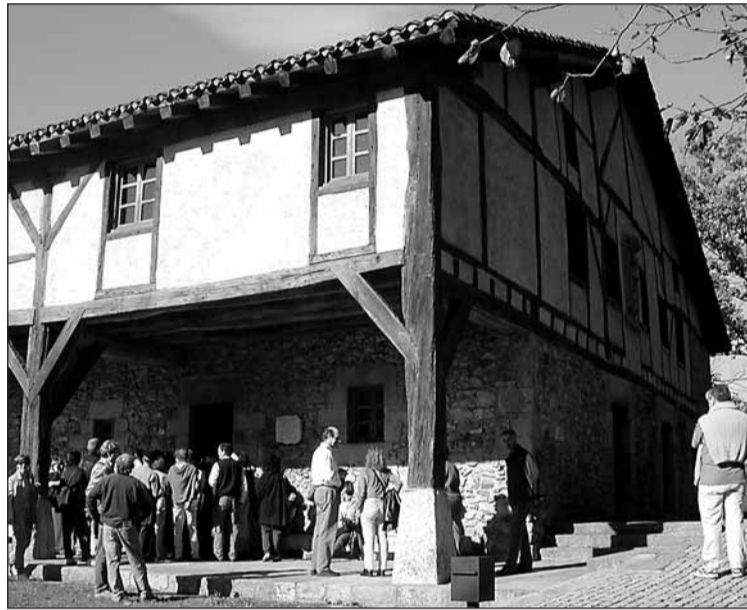
Txillida Leku gia eta guzti ikusteko aukera dute jubilatuek.

■ Eskurtsioa abuztuaren 23an da ■ Izena emateko epea bihar zabaldu eta autobusa bete artekoa da.