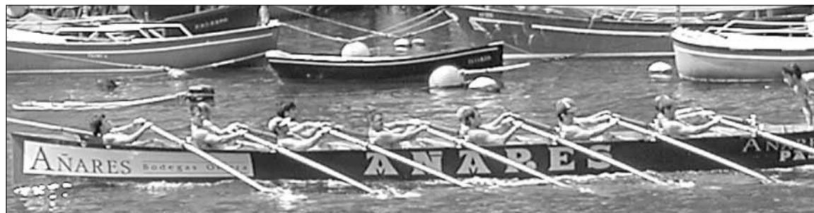
Donibaneko trainerua helmugara bidean, atzo Pasaian.

■ Zapigarren iritsi zen estropada txukuna eginda ■ Koxtape-Iberdrolako ikurrina Donibanek irabazi du eta Santiagotarrak gelditu dira bigarren hiru segundutara.