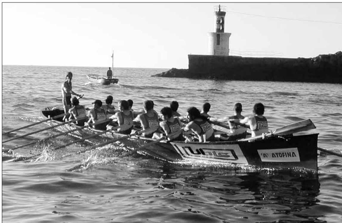
Asteburu honetako estropadak 'A' edo 'B' ligan jokatzeko balioko du.

■ Pasai San Pedroko uretan jokatu dira estropadak ■ 31 traineruk hartuko dute parte ■ Bihar 18:45etan eta etzi 19:45etan.