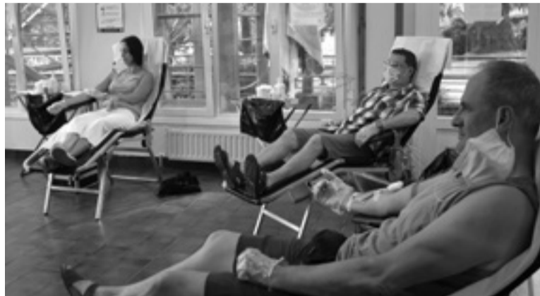
Toki gehiago eta espazio irekiagoa daukate Goiz Eguzkin, estrakzioak egiteko.

Eta aurrekoetan bezala, odola eman ahal izateko, alde zuzenetik hartu behar da ordua, oraingoan ere. Horretarako, telefonoz deitu behar da gaur goizean zehar, 08:30etan hasi eta 14:00ak arte, zenbaki honetara: