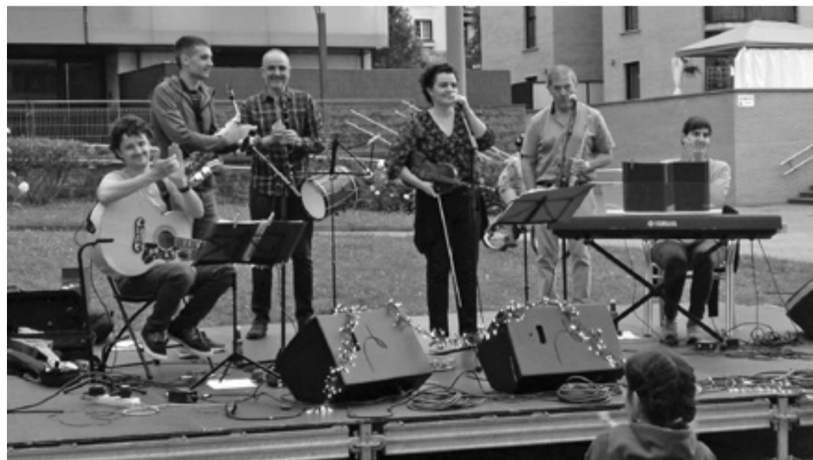
Taula gainera igo ziren, konfinamenduan auzoa alaitzen aritu diren musikarietako batzuk.